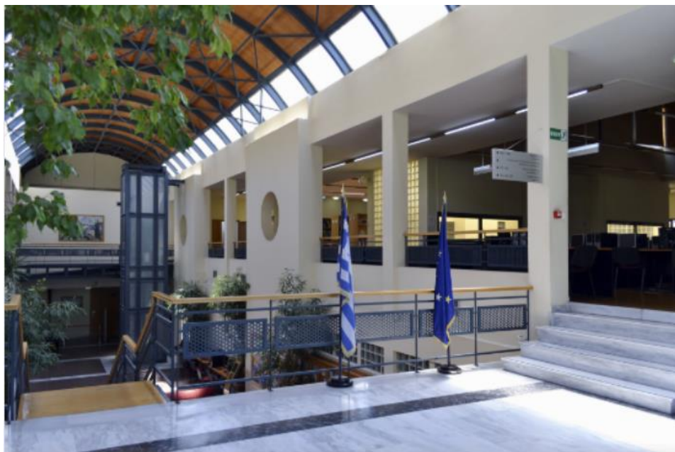
Εικόνα 1: Είσοδος αναγνωστηρίου Βιβλιοθήκης Πανεπιστημιούπολης Άλσους Αιγάλεω

Με στόχο την υψηλή γνώση και την ανάπτυξη της φιλο-“σοφίας”, το Πανεπιστήμιο Δυτικής Αττικής λειτουργεί με υψηλές προδιαγραφές (εκπαιδευτικές – ερευνητικές) και ανταποκρίνεται σε μεγάλο βαθμό στις ιδιαίτερα αυξημένες απαιτήσεις μιας σύγχρονης κοινωνίας για δημιουργία στελεχών με σοβαρή επιστημονική και τεχνοκρατική υποδομή.