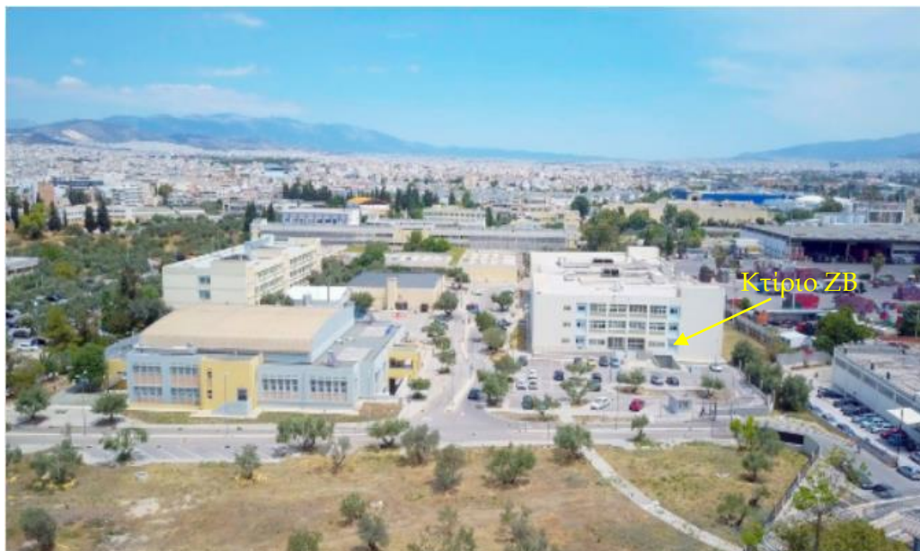
Εικόνα 4: Αεροφωτογραφία της Πανεπιστημιούπολης Αρχαίου Ελαιώνα (από Πέτρο Ράλλη)

Το Τμήμα Ηλεκτρολόγων και Ηλεκτρονικών Μηχανικών της Σχολής Μηχανικών του Πανεπιστημίου Δυτικής Αττικής έχει την έδρα του στην Πανεπιστημιούπολη Αρχαίου Ελαιώνα, που βρίσκεται στον Δήμο Αιγάλεω, επί των οδών Π. Ράλλη και Θηβών στα όρια του ιστορικού Ελαιώνα των Αθηνών, όπου δίδασκαν οι αρχαίοι Αθηναίοι φιλόσοφοι.