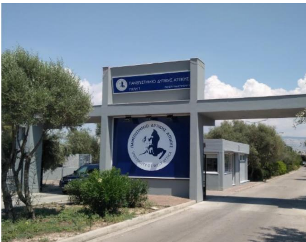
Εικόνα 2: Κεντρική είσοδος Πανεπιστημιούπολης Αρχαίου Ελαιώνα επί της Θηβών 250